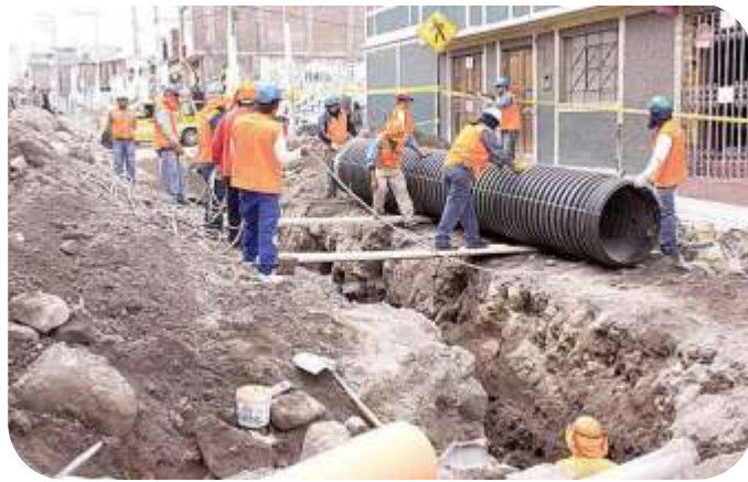
OBRAS DE SANEAMIENTO