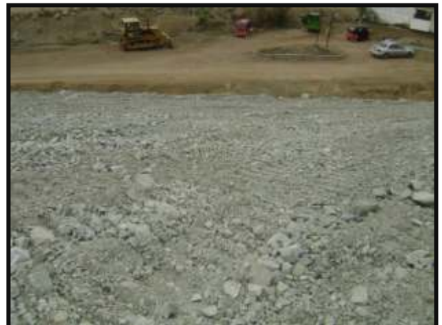
Conformación de Talud con material que proporciono el cliente se finalizo el cierre de la relavera antigua