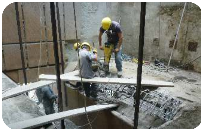
REPARACIÓN DE ESTRUCTURAS