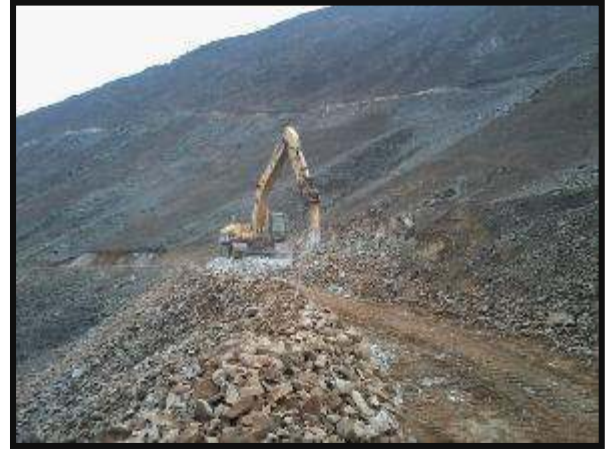
Ampliación de Vías con Excavadora sobre oruga CAT 330 CL, uso de martillo Neumático para conformación de berma a lo largo del camino.