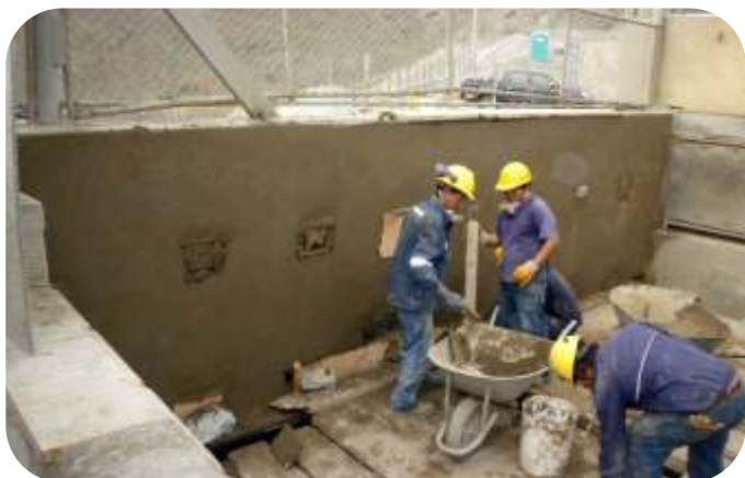
REPARACION Y TARRAJEOS