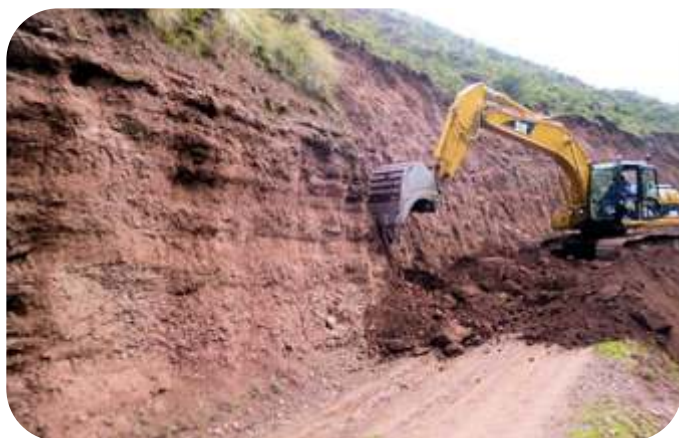
CONFORMACION DE VIAS

En la Conformación no se produce una modificación sustancial de la topografía del terreno, generalmente se evitan cambios bruscos, que no existan oquedades, riscos, barrancos, zonas y vías insegura, riberas de rios sin protección que dificulten el acceso, comunicación vial e incluso la vida de las personas.