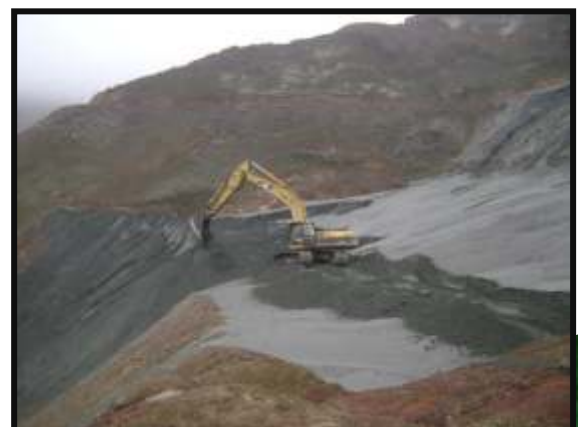
Conformación de talud y conformación de diques