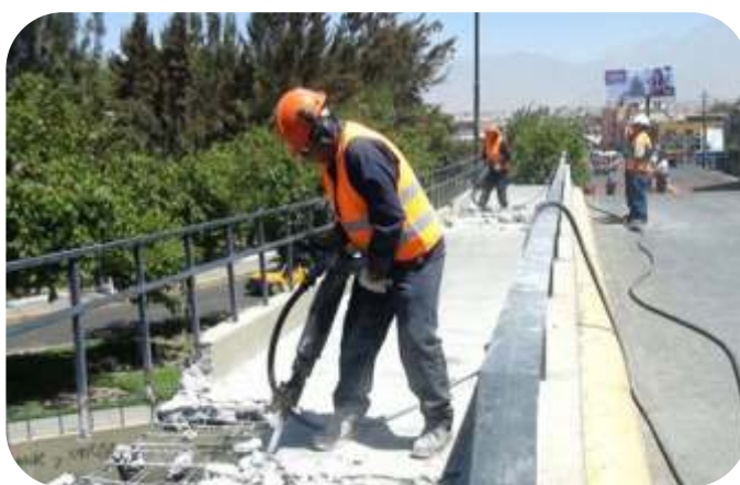
MANTENIMIENTO DE VIAS