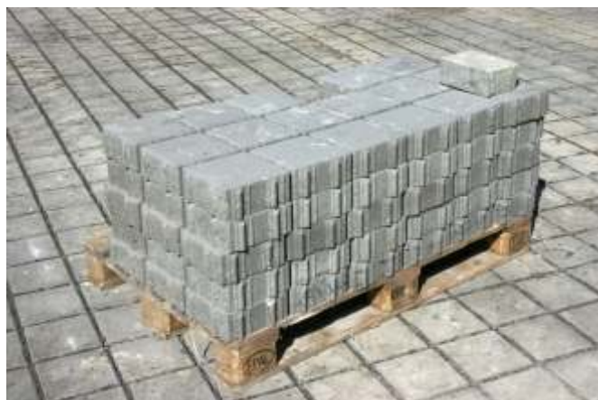
ADOQUINES Y BLOQUETAS