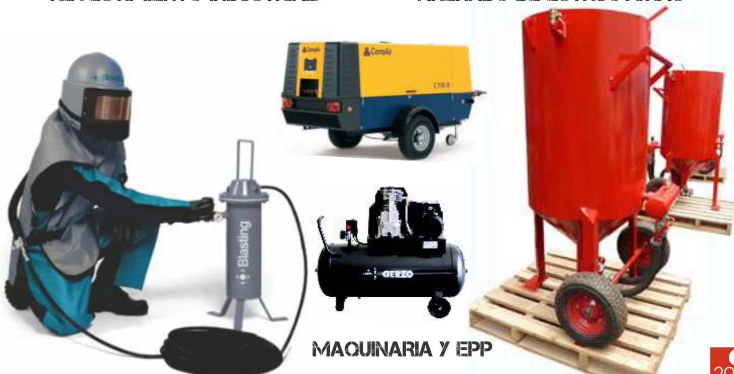
MAQUINARIA Y EPP