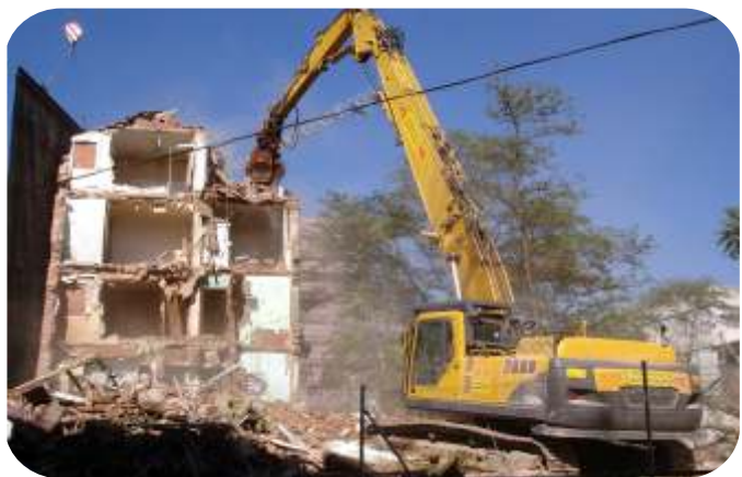
DEMOLICIONES DE ESTRUCTURAS