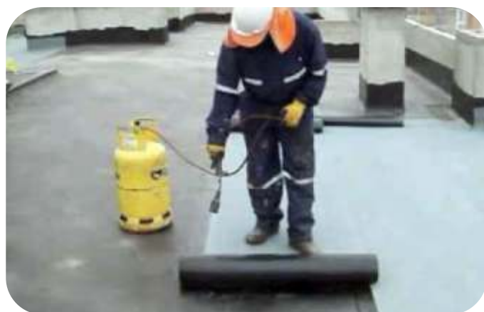
IMPERMEABILIZACION DE TECHOS