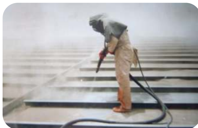
ARENADO DE ESTRUCTURAS