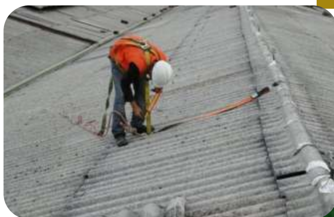
MANTENIMIENTO DE TECHUMBRE