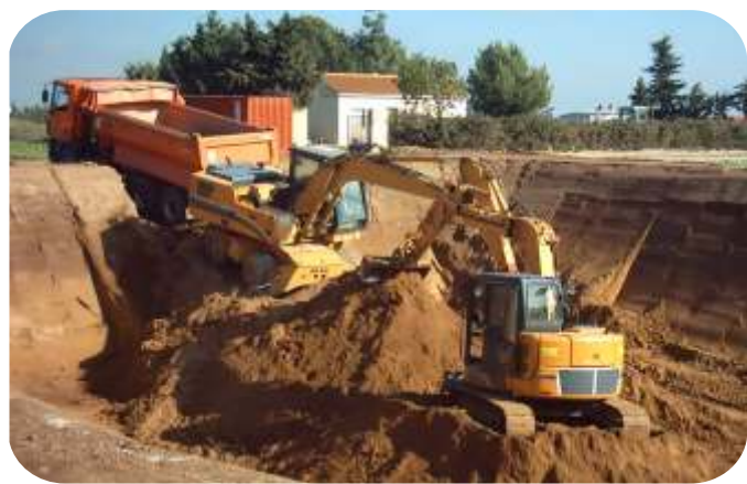
ELIMINACION DE DESMONTE