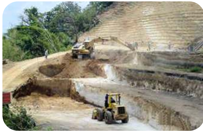
CONFORMACION DE TALUD