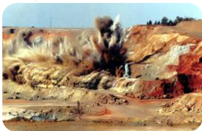
VOLADURA MASIVA Y CONTROLADA

En las Explanaciones si se acometen grandes modificaciones de la topografía lo cual con lleva al movimiento de grandes volúmenes de tierras (excavaciones y rellenos). Estas se ejecutan realizando "Estructuras de tierra y/o roca las cuales se clasifican en terraplenes, terrazas, escolleras, pedraplenes.