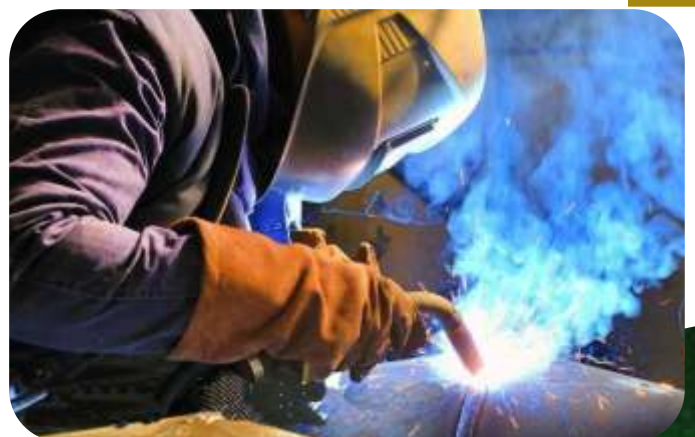
SOLDADURA ESPECIALIZADA EN GENERAL