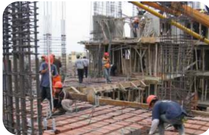
OBRAS DE EDIFICACION