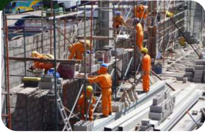
MANTENIMIENTO DE TECHUMBRE