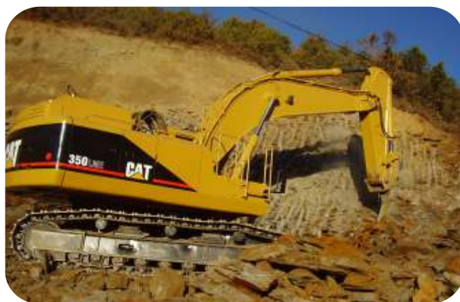
EXCAVACIONES CON MARTILLO