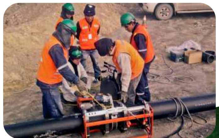
ALQUILER DE MAQUINAS