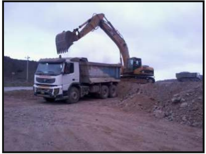
Demolición Antiguo Taller NCA