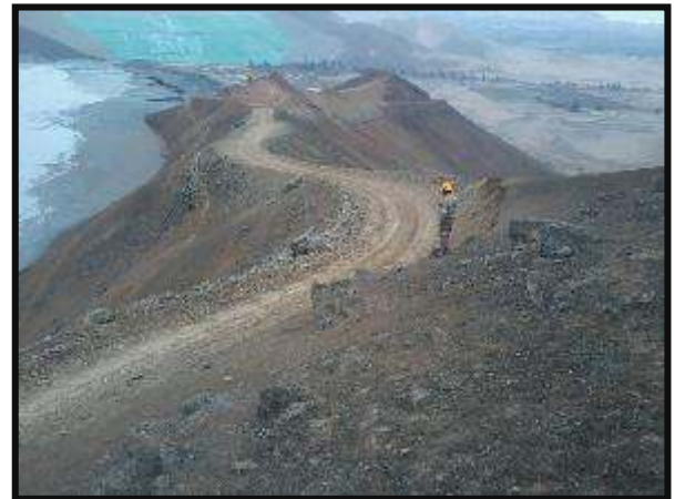
Por medio de la Ampliación de la Vía se logró un camino seguro a la zona de trabajo para así lograr la ejecución de la obra.