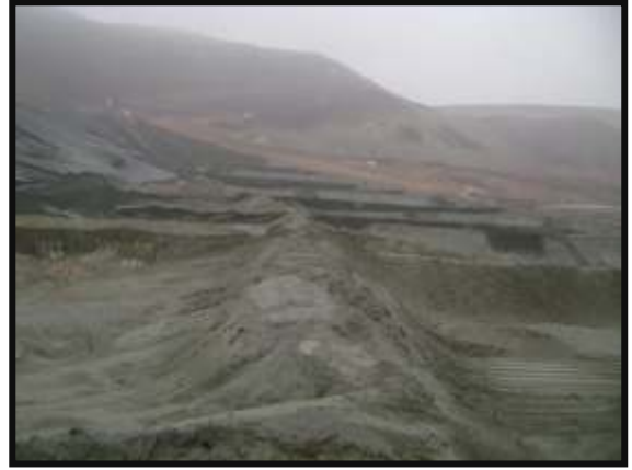
Conformación de Drenes a lo largo del pie de la Relavera N° 4