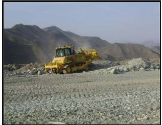
Mediante el uso de Excavadora sobre oruga y Bulldoser, se realizo la conformacion del talud para la ampliacion de la desmontera Condestable.