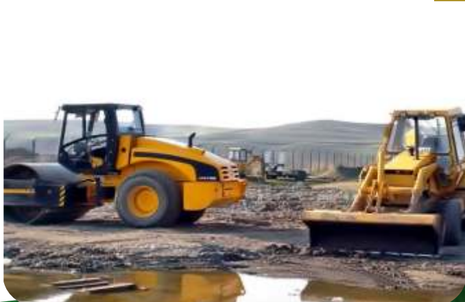
MANTENIMIENTO DE VIAS