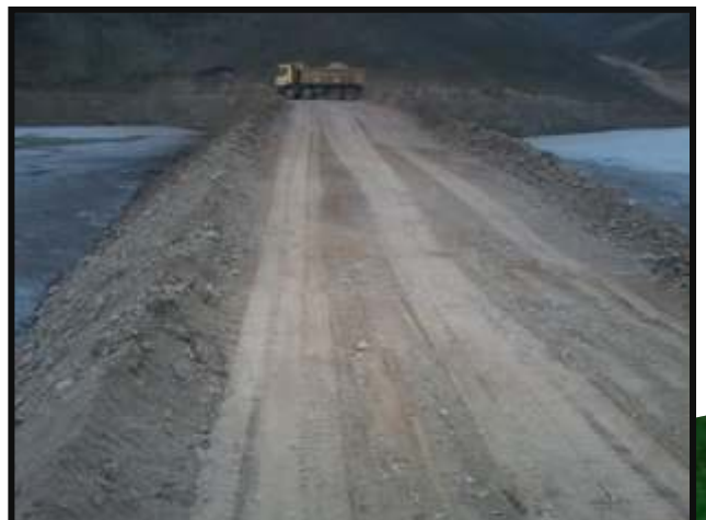
Conformación de Dique; mediante el uso de Cargador frontal y volquetes Volvo FMX,FM y Mercedes Benz