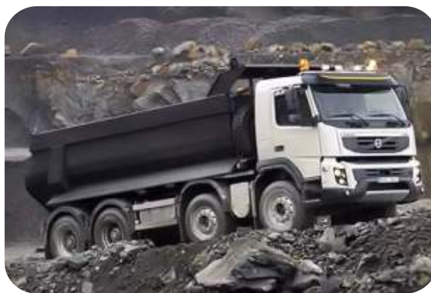
TRANSPORTE DE DESMONTE