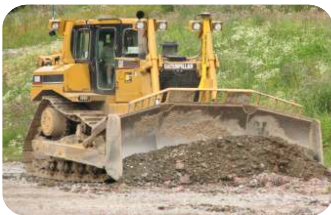
CONSTRUCCION DE ACCESOS