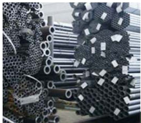
FIERROS DE CONSTRUCCION