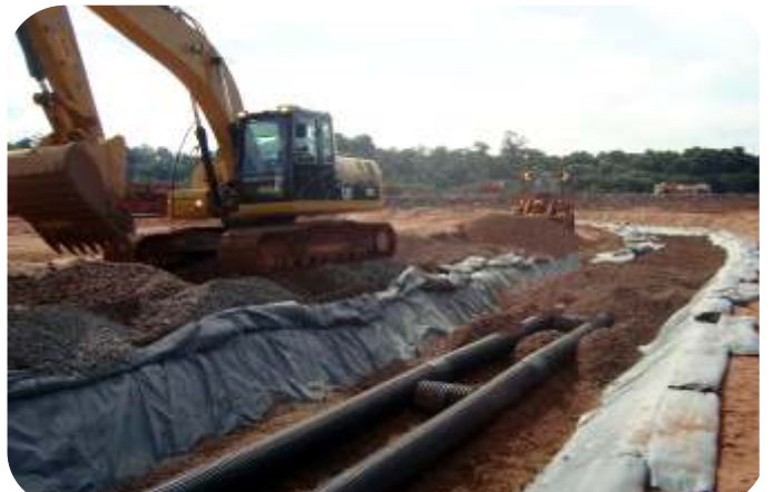
INSTALACION DE HDPE CORRUGADO