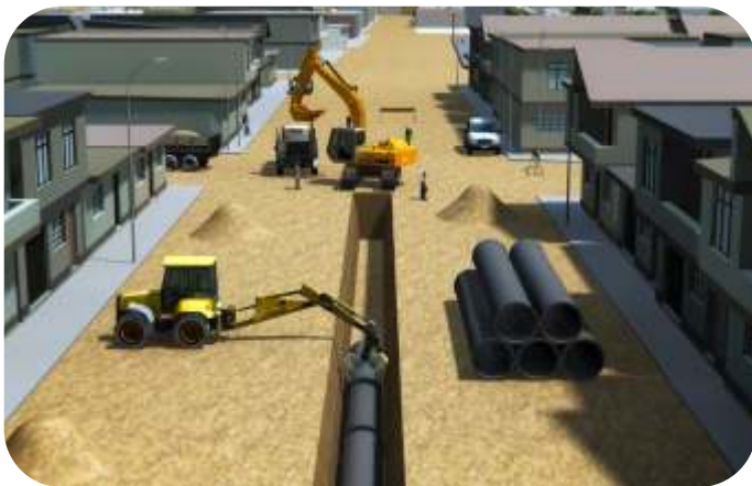
INSTALACION DE TUBERIAS HDPE