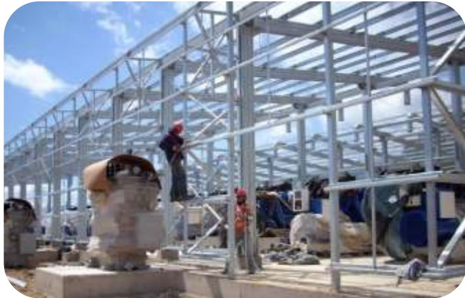
FABRICACIÓN Y MONTAJE DE ESTRUCTURAS METÁLICA

Las actividades electromecánicas implican el uso de los principios físicos para el análisis, diseño, fabricación y mantenimiento de sistemas mecánicos. Tradicionalmente, ha sido la rama de la Ingeniería que mediante la aplicación de los principios físicos ha permitido la creación de dispositivos útiles, como utensilios y máquinas.