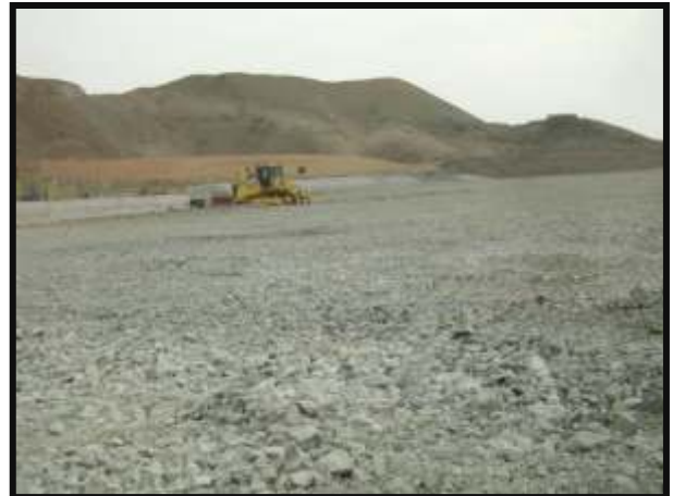
Mediante el uso de Tractores y Cargador Frontal