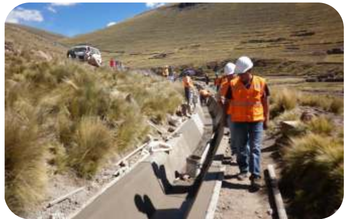
OBRAS DE IRRIGACION