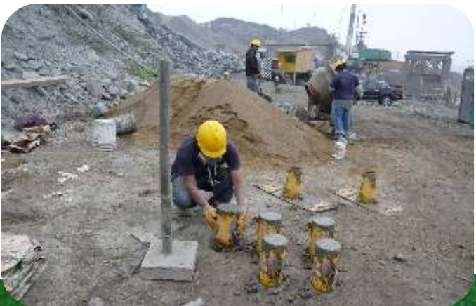
CONTROL Y CALIDAD