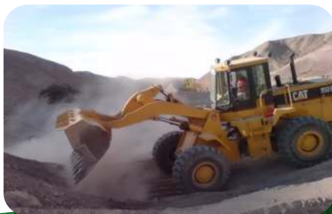
RELLENO MASIVO DE TIERRA