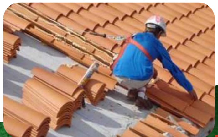
OBRAS DE TECHUMBRE