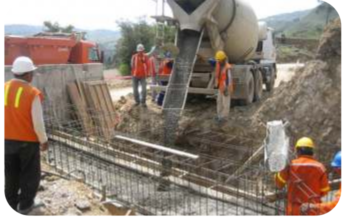
VACIADOS DE ESTRUCTURAS