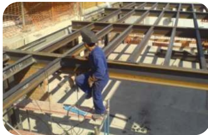
MANTENIMIENTO DE ESTRUCTURAS METALICAS