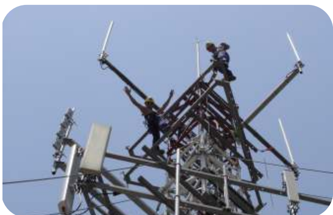
MONTAJE DE TORRETAS PARA ANTENAS