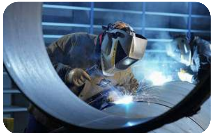
SOLDADURA ESPECIAL TUBERIAS